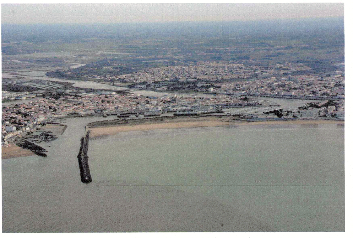
Annexe 3 au règlement CARTE DES COTES DE REFERENCE ACTUELLE BREIGNOLLES SUR MER